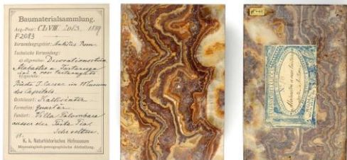
Beispiel für bereits digitalisierte Gesteine mit Inventarisierungsetikett:

Kalksinter aus Villa Palombara (Italien) verwendet für Caesar-Büste in den Kapitolinischen Museen, 1889 katalogisiert