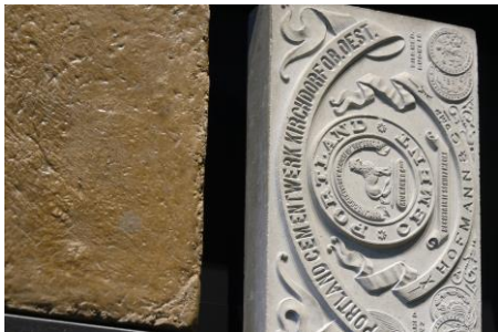
Sammlung für Bau-, Dekor- und Ziergesteine des NHM Wien