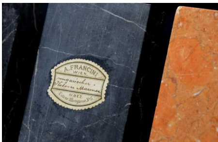
Sammlung für Bau-, Dekor- und Ziergesteine des NHM Wien