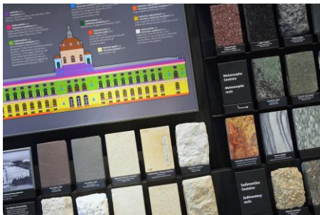
Sammlung für Bau-, Dekor- und Ziergesteine des NHM Wien