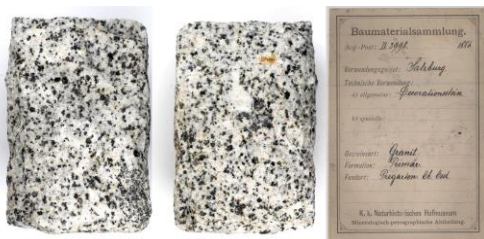
Beispiel für bereits digitalisierte Gesteine mit Inventarisierungsetikett: